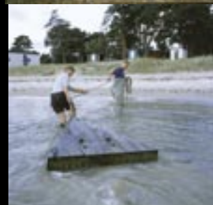
Dags att ta upp sumpen.