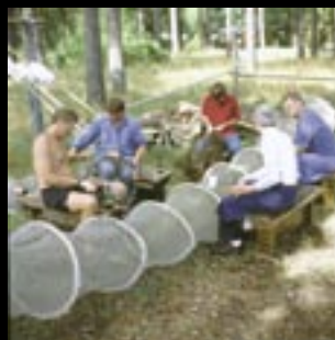
Gillesgänget bödar hommar.

Ålen fångas i ålahomnor på sin mystiska vandring till Sargassohavet. Ålen är en av de få arter som fortfarande har hemligheter för människan. Inget vet helt säkert hur ålen lever och vandrar. Men vi vet att den varje år passerar Åhus och Ålakusten. Det är då vi ställer med ålagille. Och därför är det bara här du kan uppleva ett äkta ålagille.